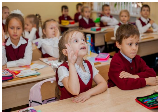
Открытый урок «Прощай Азбука» в 1Б классе