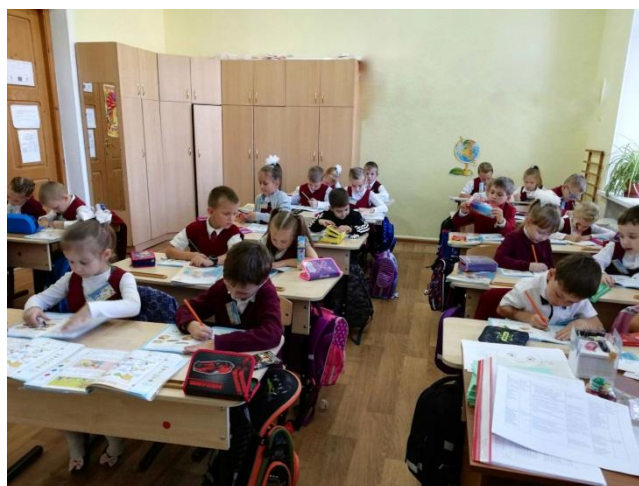
Открытый урок математики «Весёлый праздник Масленица» в 1Б классе